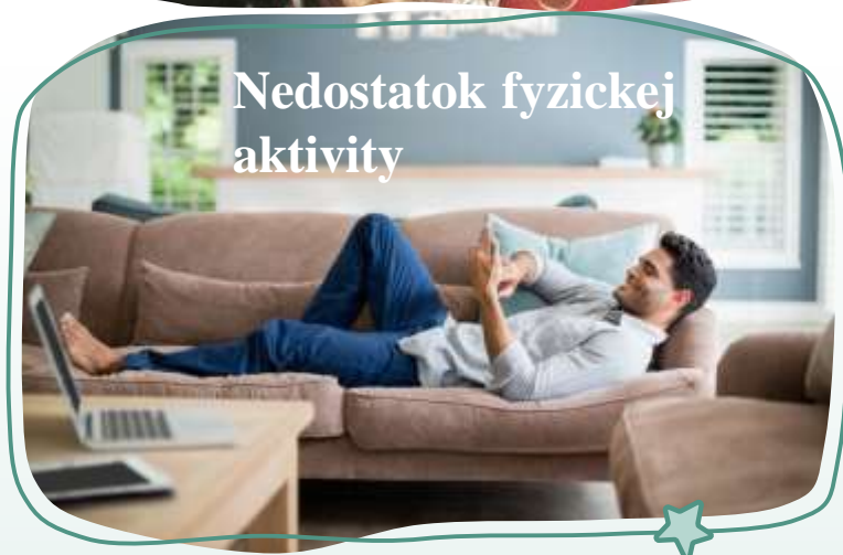
Nedostatok fyzickej aktivity