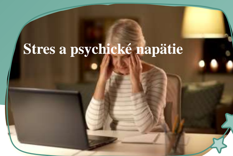
Stres a psychické napätie