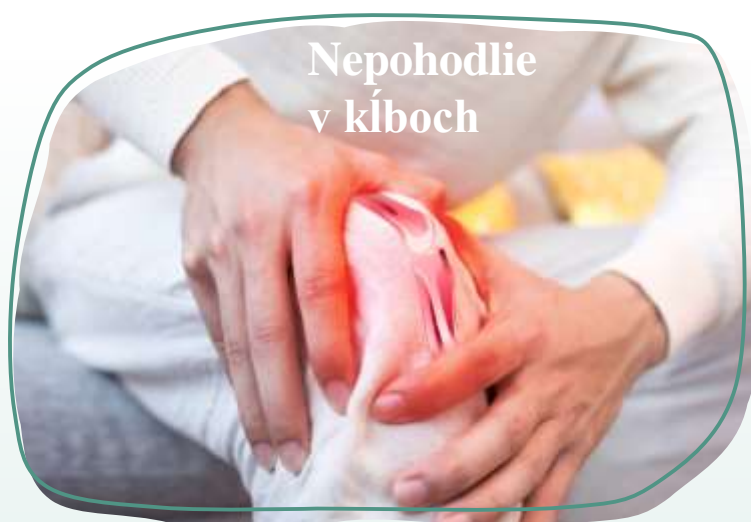
Nepohodlie v kĺboch