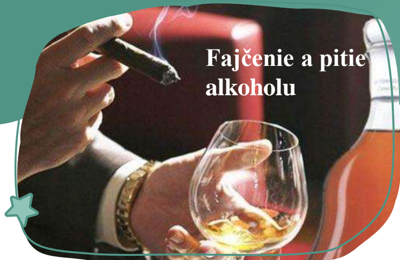
Fajčenie a pitie alkoholu